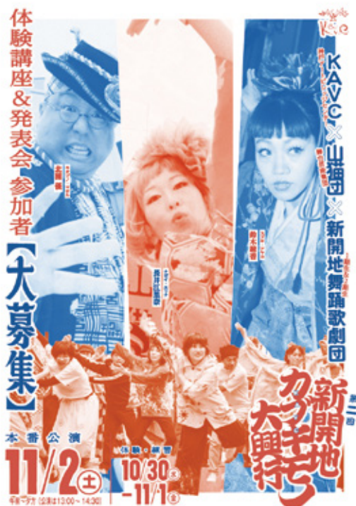
第一回 新開地カブキモノ大興行(2018年11月)の様子

第二回 新開地カブキモノ大興行 KAVC×山猫団×新開地舞踊歌劇団(一期生&二期生)体験講座&発表会 参加者募集告知チラシ