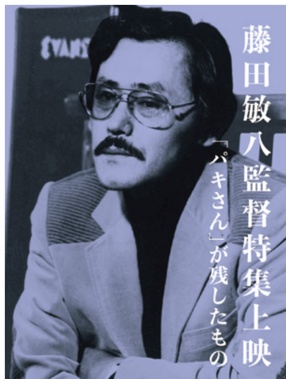
【上映期間】2019年8月17日[土]～8月22日[木] 神戸アートビレッジセンター